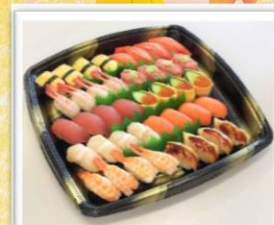
海鮮にぎり - 大皿 -