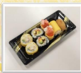
巻物各種盛り合わせ